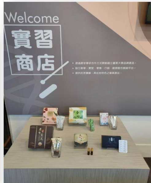
透過產官學研合作方式開創品牌產品