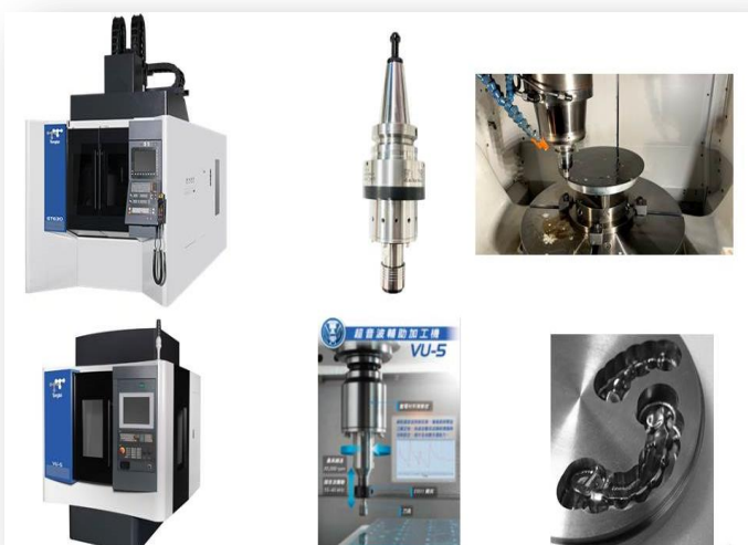
旋轉超音波輔助切削/磨削技術